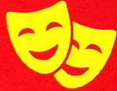
लघु नाटिका (स्किट)