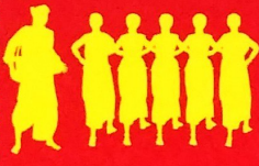
युप लोक नृत्य