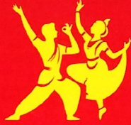
युप शास्त्रीय नृत्य